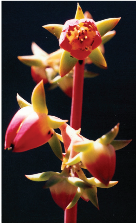
Fig. 2. Inflorescencia de Echeveria patriotica , las flores muestran los colores de la bandera mexicana que denotan el epíteto específico.

color rojo-púrpura, las otras los tienen blanquecino-amarillentos. El segundo subconjunto está integrado por plantas caulescentes, con pocas hojas, rara vez en roseta basal, las láminas por lo general son manifiestamente pseudopecioladas y sus flores tienen los nectarios pálidos; aquí pertenecen: E. acutifolia Lindley, E. crenulata Rose, E. fimbriata C. H. Thompson, E. gibbiflora De Candolle ( E. grandifolia Haworth, E. violescens E. Walther, E. gibbiflora var. violescens (E. Walther) Kimnach), E. gigantea Rose & Purpus, E. grisea E. Walther, E. longiflora E. Walther, E. pallida E. Walther, E. rubromarginata Rose y E. nayaritensis Kimnach.